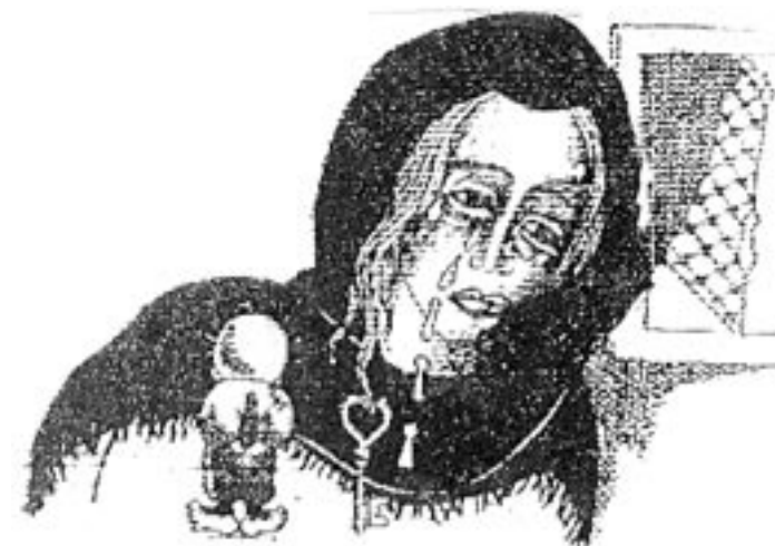
Aus den Zeichnungen von Naji al-Ali

Die Palästinenser hatten dabei allerdings nicht den geringsten Zweifel, dass dieser Exodus nur ein paar Tage dauern und sie danach wieder heimkehren würden. „Wir dachten, wir würden nach ein, zwei Wochen nach Hause zurückkehren. Wir verriegelten das Haus und behielten den Schlüssel und warteten auf die Heimkehr.“