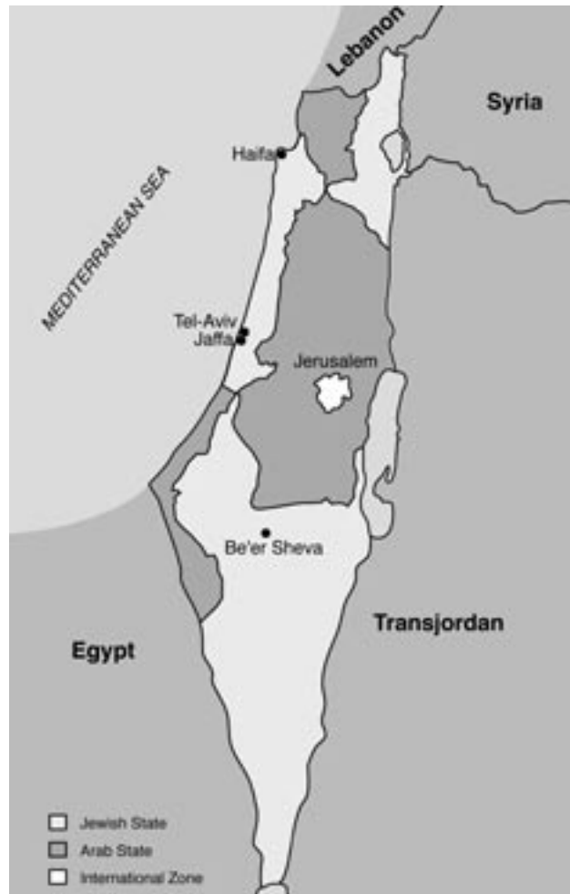
Karte: Der UN-Teilungsplan gemäß der Resolution vom 29. November 1947.

Am 29. November 1947 nahm die UN-Generalversammlung mit großer Mehrheit eine Resolution an, die dazu aufrief, zwei benachbarte unabhängige Staaten im Land Israel zu gründen (Resolution 181). Angehörige der jüdischen Gemeinschaft tanzten vor Freude auf den Straßen, aber kurz darauf griffen palästinensische Araber und Freiwillige aus anderen arabischen Ländern, die den Teilungsplan ablehnten, an. Der Krieg begann.