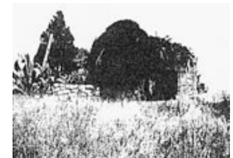
Ein verlassenes Haus in den Ruinen von al-Tannour (Jerusalem)