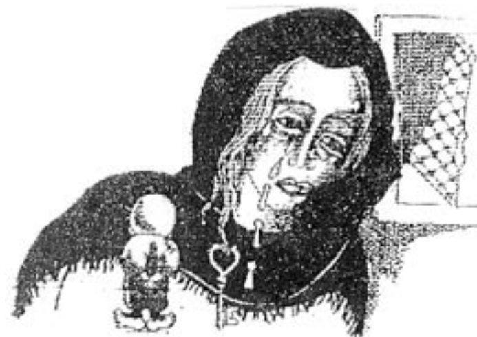
Aus den Zeichnungen von Naji al-Ali

Die Palästinenser hatten dabei allerdings nicht den geringsten Zweifel, dass dieser Exodus nur ein paar Tage dauern und sie danach wieder heimkehren würden. „Wir dachten, wir würden nach ein, zwei Wochen nach Hause zurückkehren. Wir verriegelten das Haus und behielten den Schlüssel und warteten auf die Heimkehr.“