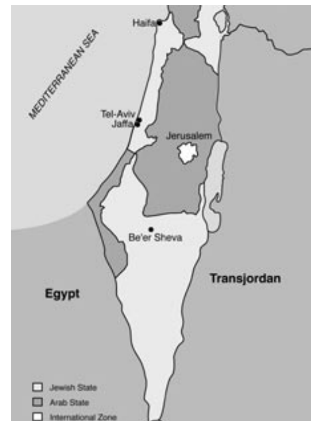
Karte: Der UN-Teilungsplan vom 29. November 1947

Nachdem die UN-Resolution 181 am 29. November 1947 von der Generalversammlung verabschiedet worden war, brachen Kämpfe und gewaltsame Auseinandersetzungen zwischen Juden und Palästinensern aus. Die Situation eskalierte zu einer ungleichen Konfrontation. Die zionistischen Kräfte waren organisiert, bewaffnet und gut ausgebildet. Sie waren nicht nur den Palästinensern überlegen, die mehr als 30 Jahre lang durch die ungerechte britische Politik und den