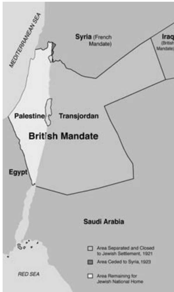
Das britische Mandatsgebiet. 1922 wurde es zweigeteilt, in Israel und Transjordanien.

Blieb die Frage: Würde Großbritannien seiner Verpflichtung gegenüber den Juden im Lande Israel nachkommen oder würde es im Interesse seiner jeweiligen Interessen und wechselnden Prioritäten dahinter zurückfallen?