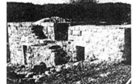
Zerfallene Häuser in al-Mansura (Akka)