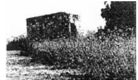
Verlassene Häuser in Kufr Lam (Haifa)