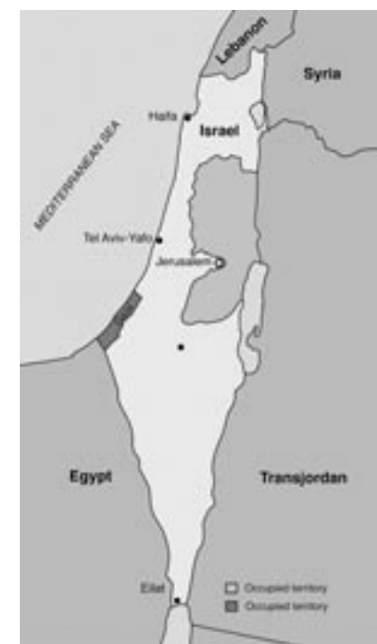
Karte Palästina vor dem Sechs-Tage-Krieg

Nach 1948 verschwand Palästina von der politischen Landkarte. Israel wurde auf etwa 78% des palästinensischen Gebietes errichtet, das Westjordanland von Jordanien und der Gazastreifen von Ägypten annektiert. Um ihre Ohnmacht zu verdecken, prahlten die arabischen Staaten, sie würden Israel auslöschen. Der Sechs-Tage-Krieg von 1967 förderte jedoch die Scheinheiligkeit und die Lügen der arabischen Medien zugute, denn innerhalb von sechs Tagen besetzte Israel die verbliebenen 22% von Palästina, die ägyptische Halbinsel Sinai und die syrischen Golanhöhen.