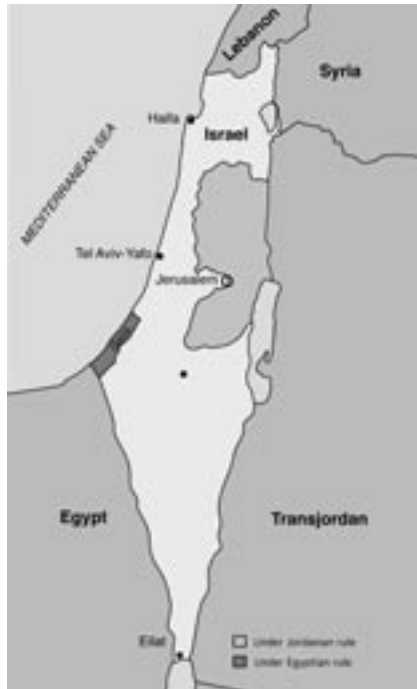
Karte: Waffenstillstandslinien nach dem Unabhängigkeitskrieg. Diese bildeten bis 1967 die Grenzen Israels.