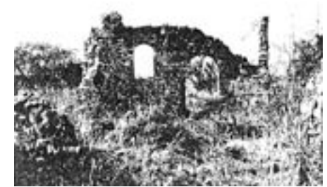
Ein verlassenes Haus in Biyar al-Adas (Jaffa)