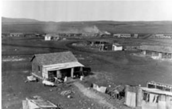
Foto: Der Moschaw Nahalal, eine genossenschaftlich organisierte landwirtschaftliche Siedlung, wurde 1921 im Jesreel-Tal gegründet.