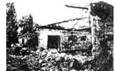
Khulda (Ramla): Ein Haus ist verlassen, das andere zerstört.