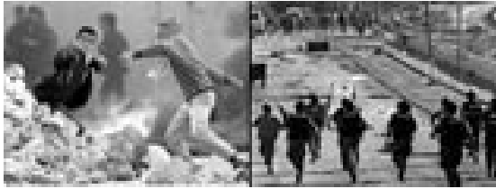
Typische Straßenszenen zu Beginn der Intifada

Israel, Jordanien und selbst die PLO wurden von der Intifada überrascht, und jede Seite entwickelte in der Folge ihre eigene Herangehensweise an dieses neue Phänomen. Das israelische Militär musste sowohl seine Taktik wie auch das Verhalten seiner Soldaten in den besetzten Gebieten neu ausrichten. Die Armee war auf Massendemonstrationen, Steinwerfer und Molotowcocktails nicht eingestellt. Die Palästinenser (einschließlich Teenagern und Kindern) bewiesen großen Mut und griffen die Soldaten auf offener Straße, in Panzerfahrzeugen und in den militärischen Einrichtungen an.