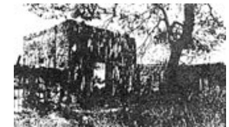
Ein zerfallenes Haus in Dschimsu (Ramlah)