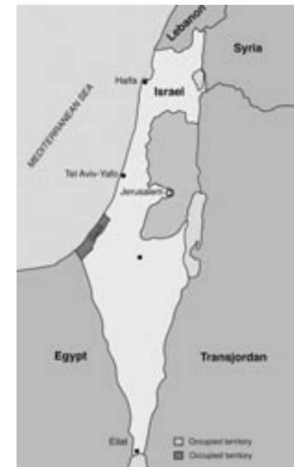
Karte: Karte von Palästina vor dem Sechs-Tage-Krieg 1967

Artikel 11 der UN-Resolution 194 vom Dezember 1948 19 legte fest, dass denjenigen Flüchtlingen, die zu ihren Wohnstätten zurückkehren und in Frieden mit ihren Nachbarn leben wollten, dies zum frühestmöglichen Zeitpunkt gestattet werden sollte und dass für das Eigentum derjenigen, die sich entscheiden, nicht zurückzukehren sowie für den Verlust oder die Beschädigung von Eigentum, auf der Grundlage internationalen Rechts oder nach Billigkeit von den verantwortlichen Regierungen und Behörden Entschädigung gezahlt werden soll.